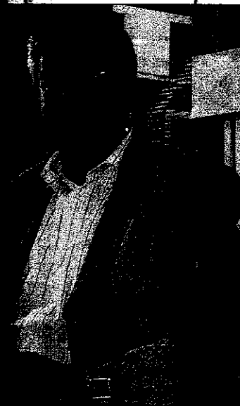
Atención Sociosanitaria del Sespa.

dencialidad en Asturias. La iniciativa presenta medidas como la instalación de cortinas o de despachos para garantizar estos derechos.